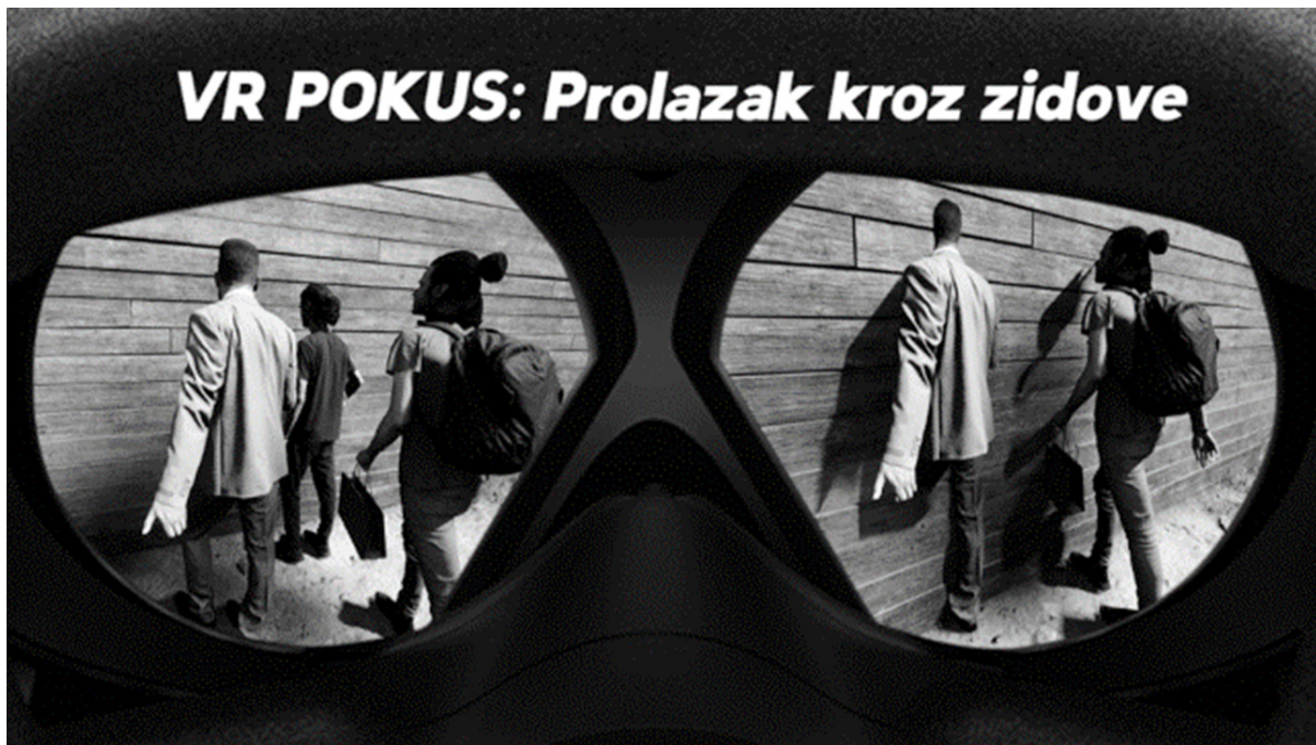
Slika 1: VR POKUS: Prolazak kroz zidove (Antonio Batini, 2022).

I u sâmom VR okruţju postoji određena metafizika kao osnovna struktura koja se instancira kroz vlastite parametre kao klase objekata, koje moraju uključivati potrebne i neobvezne atribute. Struktura omogućava razumijevanje tako-generiranog-sustava u kojemu virtualno reproducirani stvarni objekti korisniku u interakciji otkrivaju svoja svojstva. Ovdje je osim korisničkog razuma prisutan i poopćeni razum multimedijskog dizajnera danog VR-a svijeta koji je u njega upisan kao zakonitost tvorećeg principa VR-a, a koji počiva na umu kao pojmovnoj sebestvaralačkoj instanci i nominacijskom načelu. Osim teorijskog objašnjenja to je moguće prikazati i na primjeru VR pokusa prolaska kroz zidove (Slika 1).